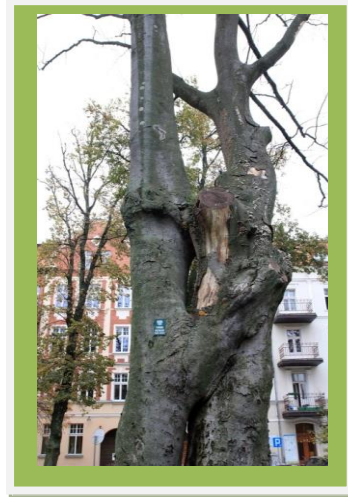
Adam i Ewa