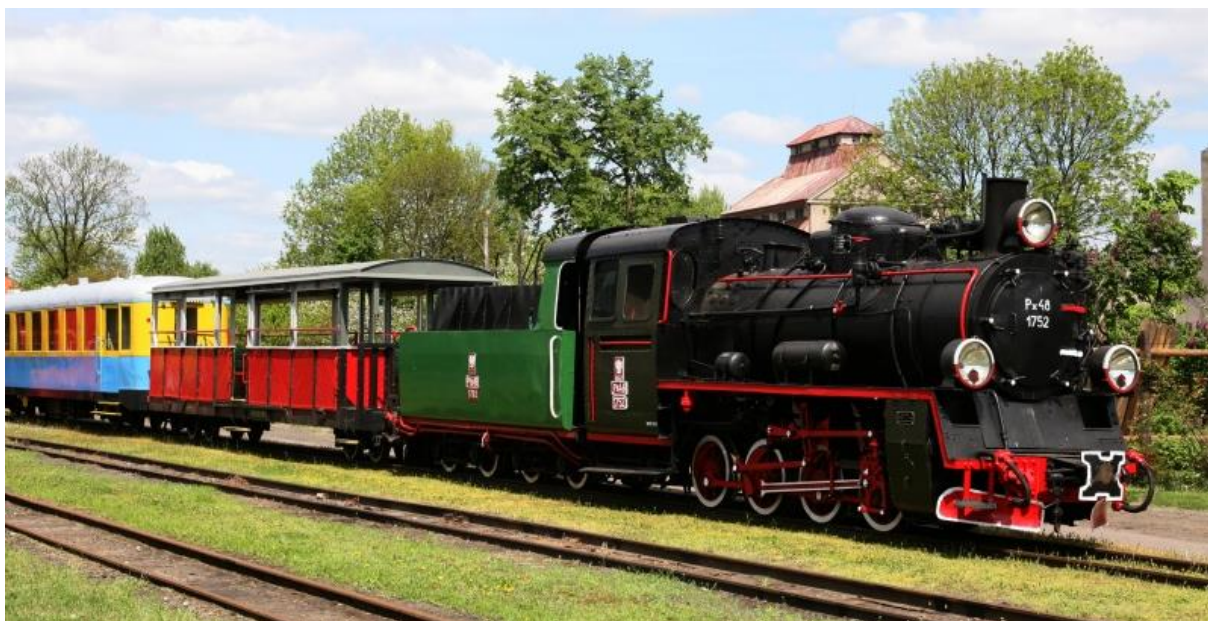
Łódka Kolej Wąskotorowa

Jeśli z tego powodu choć trochę ci żal, Wąskotorówką możesz odjechać w siną dal.