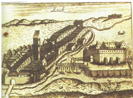
Rycina z 1684 r. z widokiem Łódki i Wyspy Zamkowej.

Teraz promenadą spacerkiem przejdziecie. Stoją tam drewniane pomniki - z nich o historii Polski się dowiedziecie.